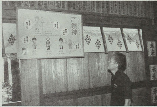
拝殿にあるラノベ風ポスター

同町では、湯前まんが美術館の開館、小・中学校で漫画授業、「漫画フェスタ」と漫画のまちづくりに力を入れている。